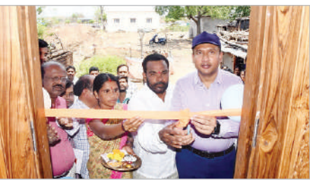
ఇచ్చోడ, ఏప్రిల్ 21 (ప్రభాత సమాచారం): ప్రజాపాలన - ప్రగతి ప్రణాళికలో భాగంగా మంగళవారం