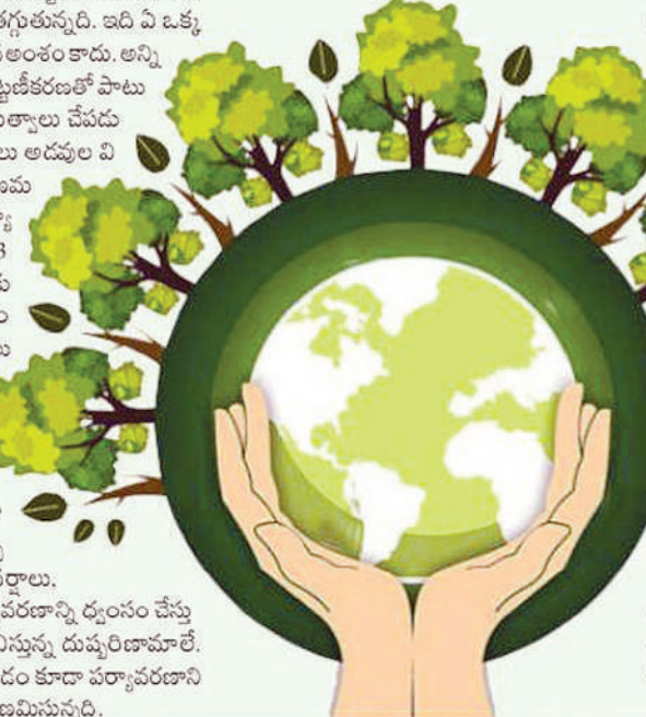
నేడు ధరిత్రి దినోత్సవం

అంతరించిపోతున్న అనేక జీవజాతులు.. ప్రపంచ వ్యాప్తంగా ఇటీవలి కాలంలో అనేక జీవజాతులు అంతరించినట్లుగా, ఇలా అంతరించిపోయే జాబితాలో ఏనుగులు, పులులు, కొన్ని రకాల కోతులు కూడా ఉన్నాయి. గత 50 ఏళ్లుగా అనేక రకాల వన్యప్రాణుల సంఖ్య కూడా బాగా తగ్గింది. చైనీస్ సాల మందర్స్ కూడా ఈ జాబితాలో ఉంది. సాల మందర్స్ మాంసం కోసం ఇటీవలి కాలంలో వేట ఎక్కువైంది. దాంతో చైనీస్ సాల మందర్స్ సంఖ్య గణనీయంగా తగ్గిపోతున్నది. వీటితోపాటు అంతరించిపోయే జాబితాలో మరికొన్ని జీవజాతుల పేర్లు కూడా ఉన్నాయి. ఇందులో అమూర్ చిరుత ముఖ్యమైనది. అమూర్.. ఇదొక అరుదైన చిరుత. తూర్పు రష్యా అడవులను ఆవాసాలుగా చేసుకుని అమూర్ చిరుతలు బతుకుతుంటాయి. అమూర్ చిరుత