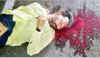
ఆగి ఉన్న టిప్పర్ను