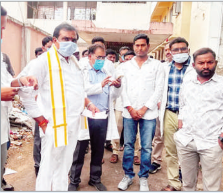
ఆదిలాబాద్, ఏప్రిల్ 21 (ప్రభాత సమాచారం)