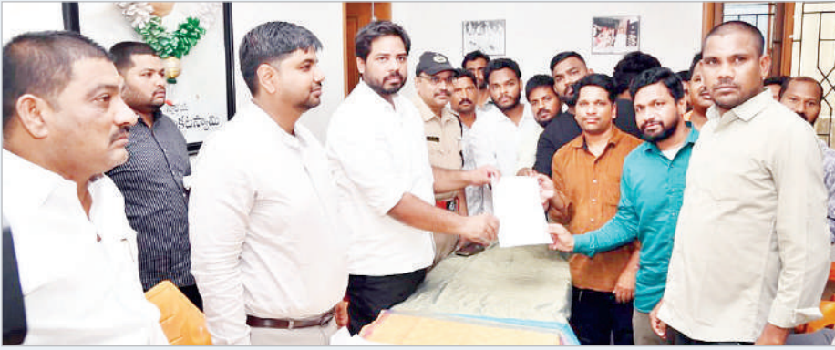
మంచిర్యాల, ఏప్రిల్ 21 (ప్రభాత సమాచారం)