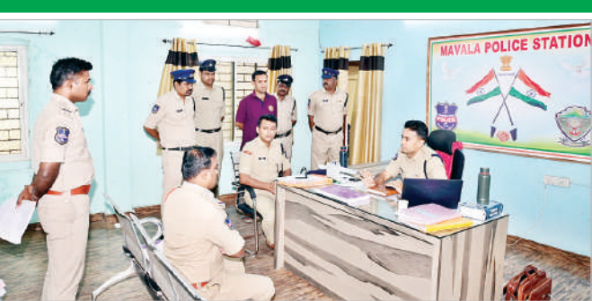
ఆదిలాబాద్, ఏప్రిల్ 21 (ప్రభాత సమాచారం)