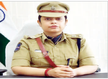
ఆసిఫాబాద్, ఏప్రిల్ 21 (ప్రభాత సమాచారం): రోడ్డు ప్రమాదాల సమయంలో గాయపడిన వారికి తక్షణ సహాయం అందించి వారి ప్రాణాలను కాపాడే బాధ్యతగల