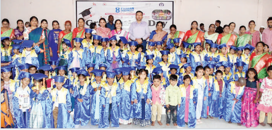
ఆదిలాబాద్, ఏప్రిల్ 21 (ప్రభాత సమాచారం)