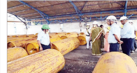
ప్రమాదాలు జరుగకుండా రక్షణ చర్యలు తీసుకోవాలి కువ్తుంబిం ఆసిఫాబాద్ జిల్లా కలెక్టర్ హరిత