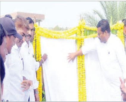
చెరువుల పునరుద్ధరణతో భూగర్భ జలాలు పెంపు