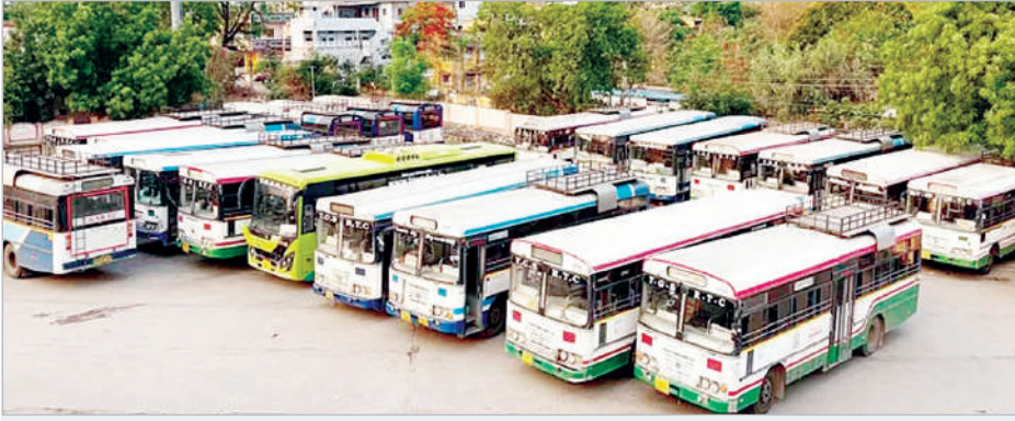
(ప్రభాత సమాచారం, ప్రత్యేక ప్రతినిధి)