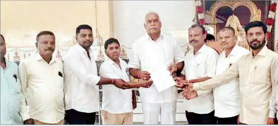
కాగజ్ నగర్, ఏప్రిల్ 22 (ప్రభాత సమాచారం) కొమరం భీం జిల్లా కాగజ్ నగర్ పట్టణంలోని నిజాం కాలంలో 1938లో స్థాపించబడిన సిర్సార్ పేపర్ మిల్లలో తక్షణమే ట్రేడ్ యూనియన్ ఎన్నికలు నిర్వహించాలని

కార్మికులు డిమాండ్ చేశారు. 2018లో పునఃప్రారంభమైనప్పటి నుండి ఇప్పటి వరకు ఎటువంటి కార్మిక సంఘ ఎన్నికలు నిర్వహించకుండా, యాజమాన్యం తనకు అనుకూలంగా ఉన్న కొందరితో కలిసి చీకటి