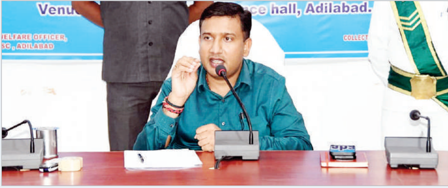
ఆదిలాబాద్, ఏప్రిల్ 23 (ప్రభాత సమాచారం)