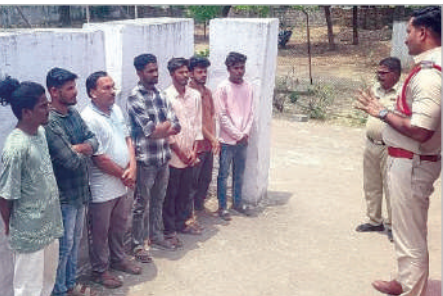
జన్నారం, ఏప్రిల్ 23 (ప్రభాత సమాచారం): జన్నారం పోలీస్ స్టేషన్ పరిధిలోని రాడీ షీటర్లు, సస్పెక్ట్ షీటర్లకు గురువారం స్థానిక పోలీస్ స్టేషన్ ఆవరణలో