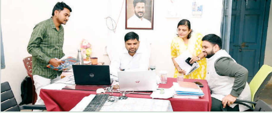
బెల్లంపల్లి, ఏప్రిల్ 23 (ప్రభాత సమాచారం)