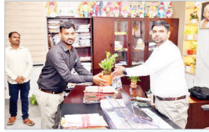
మంచెర్యాల జిల్లా సహాయ కార్మిక