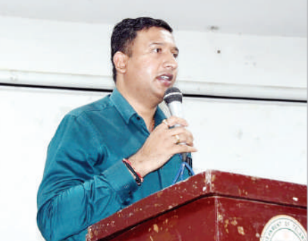
ఆదిలాబాద్, ఏప్రిల్ 23 (ప్రభాత సమాచారం)