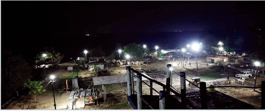
ఆదిలాబాద్, ఏప్రిల్ 24 (ప్రభాత సమాచారం):