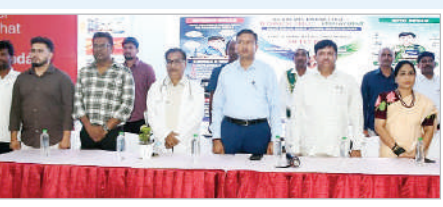
ఆదిలాబాద్, ఏప్రిల్ 24 (ప్రభాత సమాచారం)