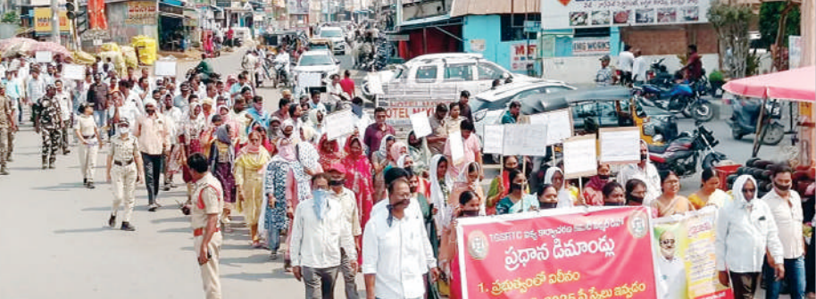
నిర్మల్, ఏప్రిల్ 24 (ప్రభాత సమాచారం) ఆర్టీసీ కార్మికుల న్యాయమైన డిమాండ్లను పరిష్కరించాలని

కోరుతూ కార్మికులు, ఉద్యోగులు చేస్తున్న సమ్మె శుక్రవారం నాటికి మూడో రోజుకు చేరుకుంది. ఇందులో భాగంగా డిపో