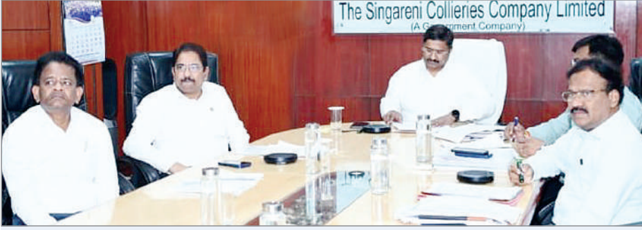
బెల్లంపల్లి, ఏప్రిల్ 24 (ప్రభాత సమాచారం)