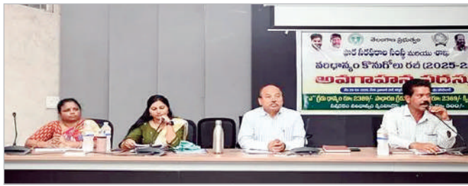
ఆసిఫాబాద్, ఏప్రిల్ 27 (ప్రభాత సమాచారం):