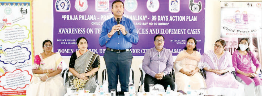
ఆదిలాబాద్, ఏప్రిల్ 27 (ప్రభాత సమాచారం):