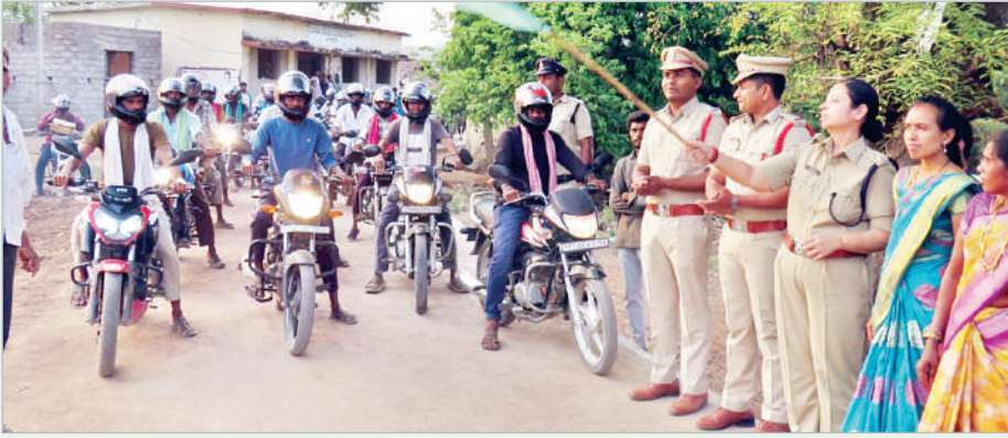
కెరమెరి, ఏప్రిల్ 27 (ప్రభాత సమాచారం):

ప్రతీ ప్రయాణం సురక్షితం కావాలని జిల్లా ఎస్పీ నితికా పంత్ అన్నారు. మంగళవారం కెరమెరి మండలం ఆగం పాదా గ్రామంలో అరెస్ట్- అరెస్ట్ కార్యక్రమంలో భాగంగా పోలీసుల ఆధ్వర్యంలో సర్పంచ్లు, గ్రామస్థుల సహకారంతో ద్వితీయ వాహనదారులకు హెల్మెట్ల పంపిణీ కార్యక్రమం చేపట్టారు. ఈ సందర్భంగా ఎస్పీ మాట్లాడుతూ గ్రామ సర్పంచ్లు, గ్రామస్థుల చొరవతో గ్రామంలో 100 హెల్మెట్ల పంపిణీ చేయాలని సంకల్పం తీసుకోవడం అభినందనీయమన్నారు. ప్రతి ద్వితీయ వాహనదారుడు తప్పని సరిగా