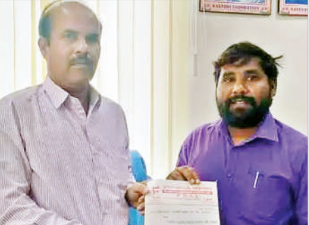
మంచిర్యాల, మే 6 (ప్రభాత సమాచారం) అడ్మిషన్ల పేరిట కార్పొరేట్ విద్యార్థులను చేస్తున్న దోపిడీని,