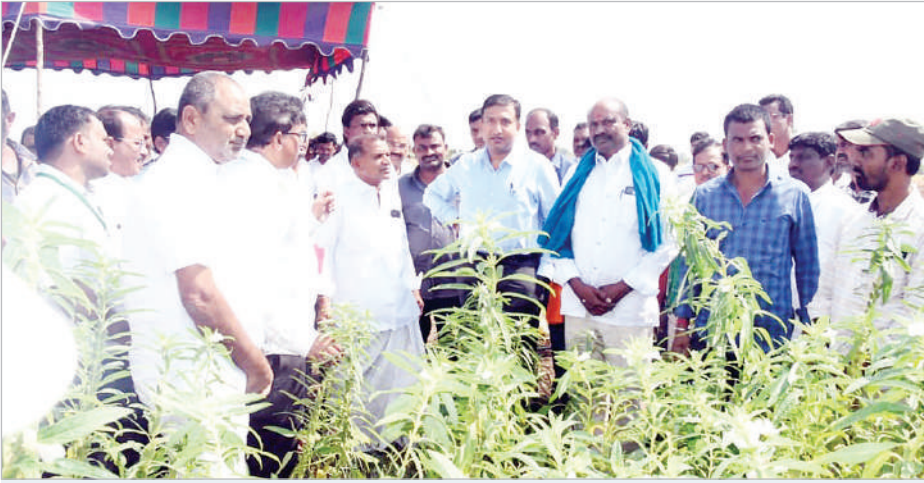
తాంసి, మే 6 (ప్రభాత సమాచారం)