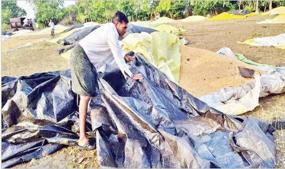
(ప్రభాత సమాచారం, ప్రత్యేక ప్రతినిధి)

జిల్లాలో మంగళవారం అర్ధరాత్రి కురిసిన అకాల వర్షం వివిధ మండలాల్లోని రైతులు, ప్రజలకు అపార నష్టాన్ని మిగిల్చింది. భారీ వర్షం కారణంగా కొనుగోలు కేంద్రాల్లో అమ్మకానికి ఉంచిన ధాన్యంతోపాటు కోతకు వచ్చిన పంట పూర్తిగా తడిసి ముద్దకాగా, పెద్ద మొత్తంలో మామిడి నేల రాలి రైతులకు తీరని నష్టం వాటిల్లింది. గత నాలుగైదు రోజులుగా వాతావరణంలో మార్పులు సంభవిస్తుండగా, ఊహించని రీతిలో అర్ధరాత్రి చెలరేగిన గాలివాన బీభత్సం సృష్టించింది. అకాల వర్షానికి జిల్లాలోని కోటపల్లి, బెల్లంపల్లి, జైపూర్, భీమారం, చెన్నూరు, మందమర్రె, కన్నెపల్లి మండలాల్లోని 1830 మంది రైతులకు చెందిన 3191 ఎకరాల పరిధాన్యం నీటి పాల్చింది. అలాగే జైపూర్, దండేపల్లి, హాజీపూర్ మండలాల్లోని 140 మంది రైతులకు చెందిన 411 ఎకరాల్లో మామిడి పంట దాదాపు 50 శాతం మేర దెబ్బతిన్నట్లు ఉద్యానశాఖ అధికారులు అంచనా వేస్తున్నారు. వివిధ మండలాల్లో గాలివాన కారణంగా విద్యుత్ స్రంబాలు విరిగి పడి విద్యుత్ సరఫరాలో అంతరాయం ఏర్పడింది. వృక్షాలు రోడ్లకు అడ్డం గా నేలకొరగడంతో రాకపోకలకు అటంకాలు ఏర్పడ్డాయి. పలుచోట్ల ఇంటి పైకప్పులు ఎరిగిపోగా, గోడలు కూలిపోయి ఇబ్బందులు పడ్డారు.