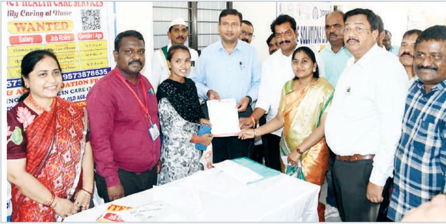
ఆదిలాబాద్, మే 6 (ప్రభాత సమాచారం)